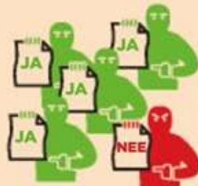
Alle crediteuren stemmen in met schuldsanering, op één na