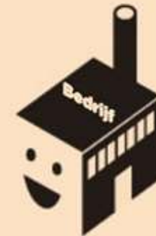
Geen faillissement en dus geen waardevernietiging en liquidatie