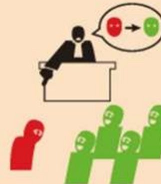
Rechter kan die ene crediteur dwingen akkoord te gaan met saneringsvoorstel