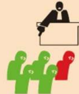
Rechter kan crediteuren besluit opleggen