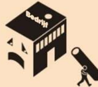
Bedrijf failliet, waardevernietiging. Vrijwel altijd geliquideerd