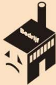
Bedrijf in financieringsproblemen

Eén schuldeiser kan in Nederland beslissend zijn voor al dan niet failliet gaan. In het Verenigd Koninkrijk is dat anders